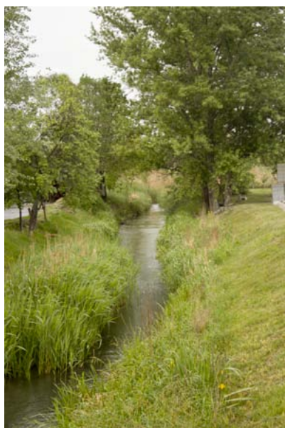
A Hejő belterületi szakasza 2012