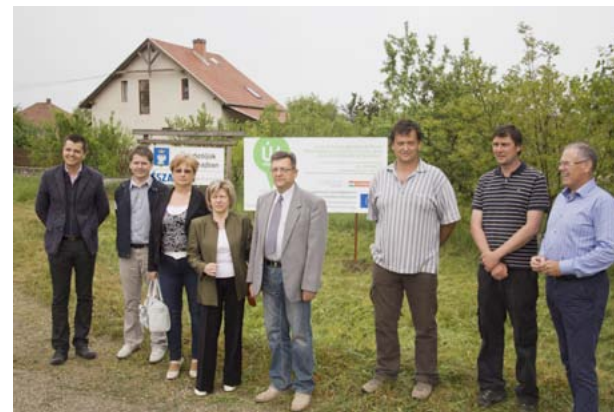
A munkaterület átadása